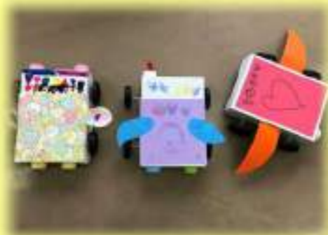
⑳キャップで作るエコカーおもちゃ あいち健康スポーツ応援団