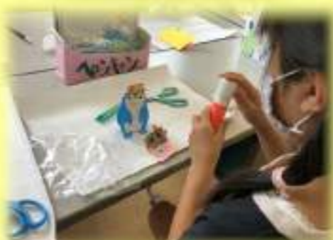
⑲飛び出すカードを作ろう よさこい鳴子踊り和