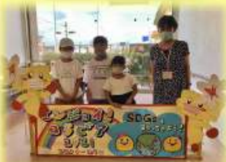
①中学1年生の君へSDGs入門編 うちエコにこの森