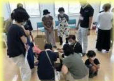
⑪オーガニックマルシェ@コラビア Farm to Table～農と食をつなぐ～