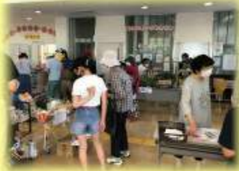
⑤コラビア朝市 コラビア