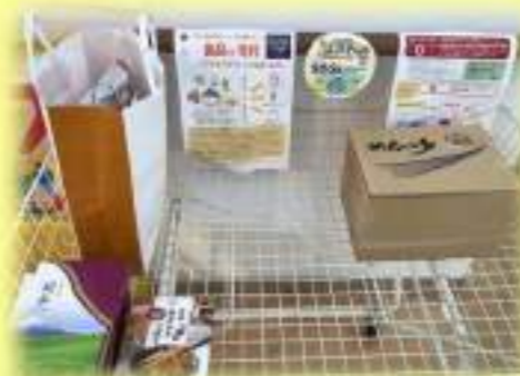
⑱食品の寄付にご協力ください! 子育て支援サークルあそびのいっぽ