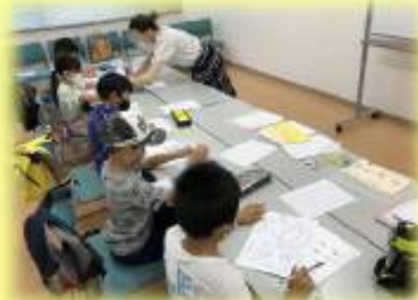
⑮⑯ひらがなのコツ、楽しく学ぼう♪ そろばんえんぴつペンの和♪