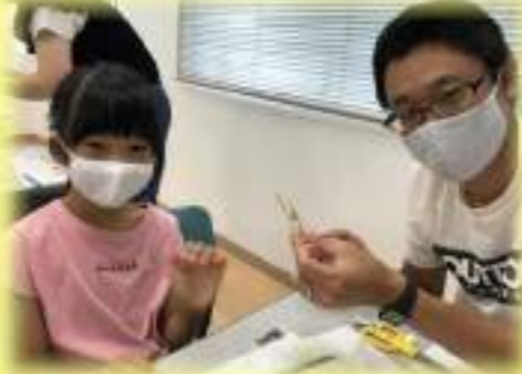
⑮ハーバリウムボールペンを作ろう はなあそび