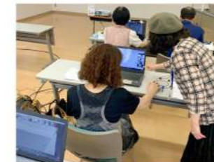
どんな感じですか？