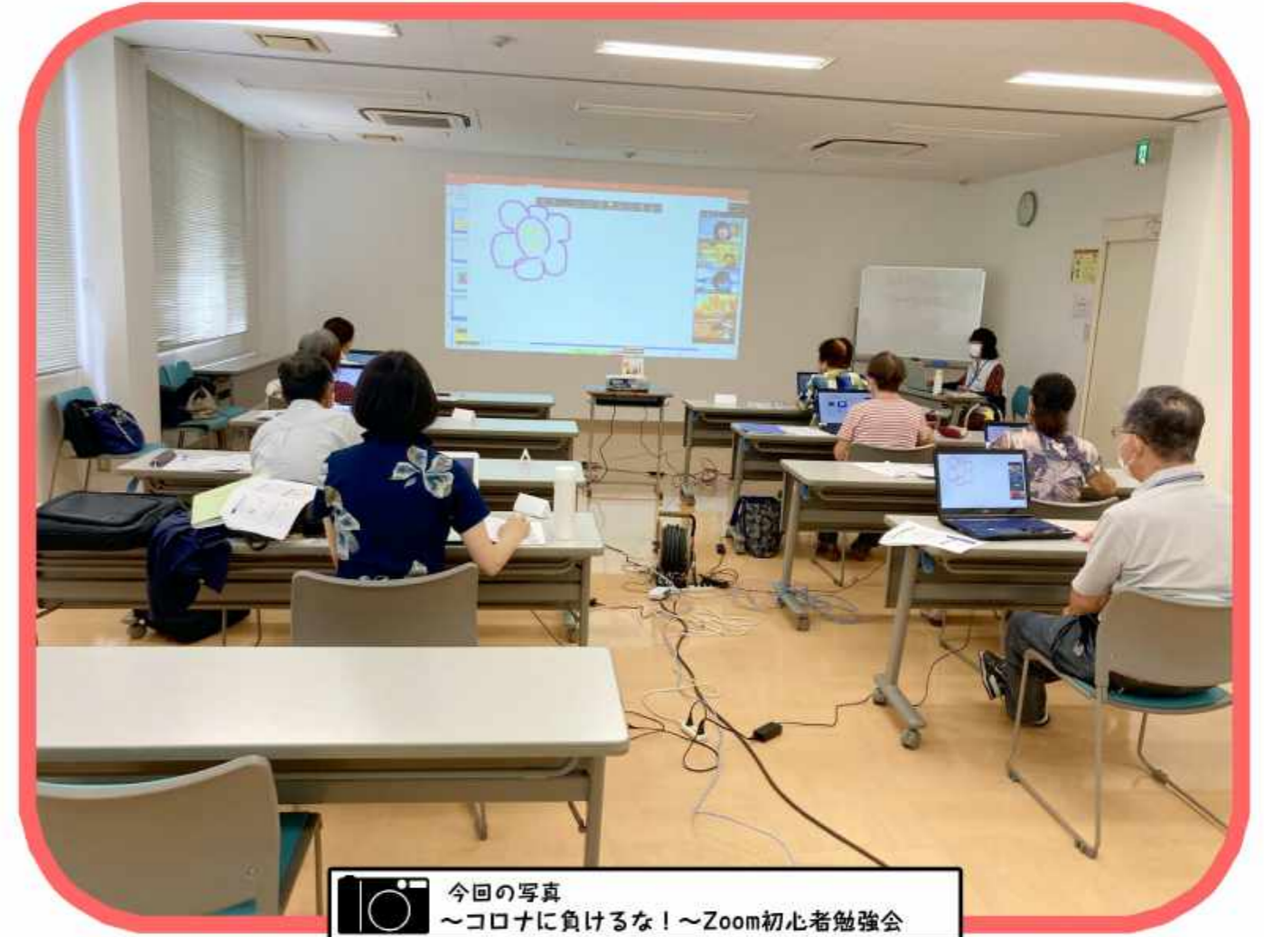
今回の写真 ～コロナに負けるな！～Zoom初心者勉強会