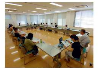
会議の様子。Zoomで参加のシェフさんも！

その後、新しい生活様式に基づいた、こらび庵の今後の活動方法について話し合いました。ざっくばらんな話し合いの中、斬新な意見もありましたが、一番感じたのは、やはり皆さんコロナ感染に対する不安はありながらも、こらび庵の再開を望んでいるんだなあとということです。参加して頂いたシェフの皆様の貴重な意見を集約し、今後のこらび庵活動に活かしていきたいと思えます。