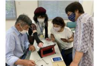
団体メンバーでZoomミーティング実践練習