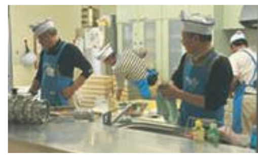
コラビアまつり2012では、ミニうどんとおにぎりで来場者のお腹を満たしてくれました。

これまで一番印象深いのは、H14年に初めて福祉健康フェアでうどんを300食出した時の事です。みんな、よく300食も作ったなあ。何しろテントの中で