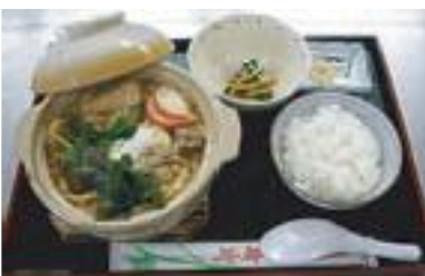
この冬に登場した味噌煮込みうどんはお客様の心もホッカホカにしてくださいました。

大勢が動くのですから、ゆでるハソリと、お出しのハソリをどこに置くか、井には先に麺を入れるのか出し汁を入れてから麺を入れるのか、一つひとつイメージをして準備したことを思い出します。