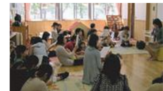
子育て支援活動。医師を招いて子どもの病気についての講座を行いました。

「みらいっこ」を法人化するきっかけとなったのは、地域の区長さんの言葉でした。「これからは、市民が行政の担い手になる時代だ。」そう背中を押され、それからNPO法人格について勉強しました。法人化に関しては、スタッフの間でも意見が分かれました。私たちは主婦だから、そんな大きなことはできない、今のままです。でも、主婦だからこそ、やってみようと思えました。協議を重ね、いざ手続きをするため、名古屋の相談窓口を訪ねると、担当者に「みなさんは主婦だから、やめておいたほうがいい。きつと長く続きませんよ。」と言われました。そこで、火がつきま