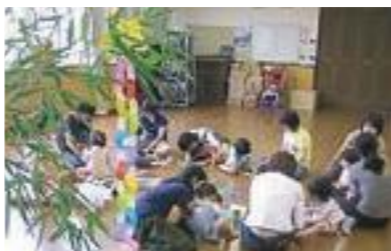
地域の集会所にて。七夕が近いので七夕飾りを作りました。

「みらいっこ」を法人化するきっかけとなったのは、地域の区長さんの言葉でした。「これからは、市民が行政の担い手になる時代だ。」そう背中を押され、それからNPO法人格について勉強しました。法人化に関しては、スタッフの間でも意見が分かれました。私たちは主婦だから、そんな大きなことはできない、今のままです。でも、主婦だからこそ、やってみようと思えました。協議を重ね、いざ手続きをするため、名古屋の相談窓口を訪ねると、担当者に「みなさんは主婦だから、やめておいたほうがいい。きつと長く続きませんよ。」と言われました。そこで、火がつきま