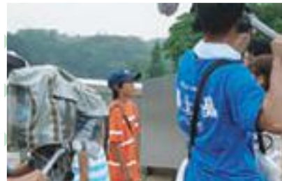
★雨の日の撮影 撮影は大変でしたが、雨のおかげで、しっかりと良いシーンにできあがりました。

■製作にあたり、苦労した点はどこなところでしょうか。 作っていく過程の中でいかに郷土感を出していくかは苦労した点のひとつです。特にロケーションハンティングには頭を悩ませました。ロケハンをしていく自分たちもこんなところにある自分たちもこんなところを発見もあり、そういうことを確認しながら製作できました。 おもなロケ場所は、神社(藤江神社や長草天神)や公園ですが、よく知られている場所はポイントとしておさえたいつもりです。ただ、自然だけではなく、工業地帯もあり、商業地域も、新しい施設もある。今の大府や東浦の《そのま》を感じていただけるように意識しました。 そして、特に気をつけたのは登場人物となる子ども達の目線です。ふと立ち寄る場所、歩く道:自分たちの子ども時代は、今と大きく《今の子ども目線》を大切に考えました。撮影に関しては、すべてが大変でした。脚本から始