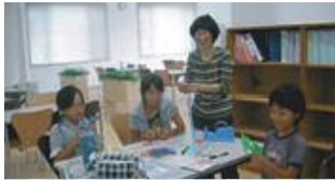
★コラピアにて 台本読み合わせはコラピアの会議室で行いました。休憩時間にコラピアスタッフと一緒に七夕飾りを作りました。

郷土愛は人生を積み重ねていく中で育まれるものだと思います。そういつた意味でも、完成してから何年か経つて、この撮影のことを思い出せば、ふつと芽生えてくると思ひます。