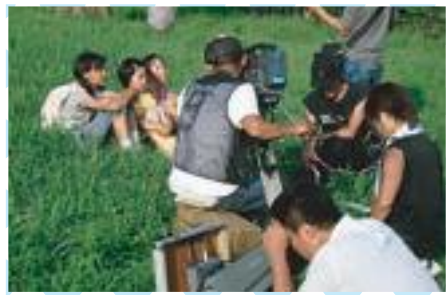
★地元での撮影 映画には大府、東浦の良いところをたくさんでできます。

この場面をどこで撮るか、ということとは地元の人でないとわからないですね。それはこちら側で提示していきまいた。互いに補い合えないかと思ひます。