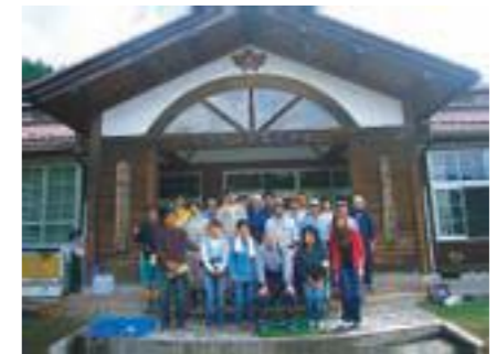
↑住田基地の前で。参加者は一般の方に加え、市職員、コラビアスタッフあわせて21名。

NPO愛知ネットでは、大府市の協力を得て、東日本大震災被災地支援として岩手県気仙郡住田町へ向かうボランティアバスの運行を企画しました。コラビアからも2名のスタッフが参加しました。その様子を簡単に報告いたします。