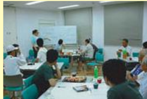
7月8日(金) 19:00~21:00 「わかちあいの会」(ワークショップ形式) ～被災地のボランティアを終えて～