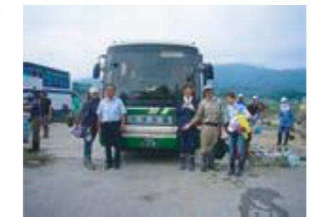
↑今回のバスは現地のバス会社、「大洋交通」さんにお願ひしました。お世話になりました。