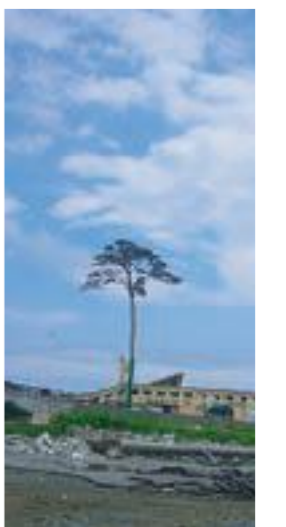
↑復興のシンボル、一本松が青空にそびえたつ姿がとても印象的でした。被災された皆様が一日でも早く日常生活にもどれるよう、願わずにはられません。