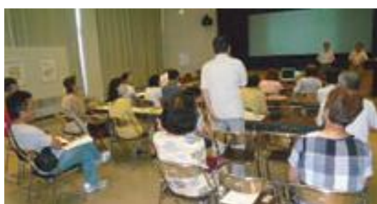
7月31日(日)、大府公民館にて説明会&相談会、パネル展示を行いました。

た。そのため、隣の庭、畑で糞をするといったようなトラブルが頻繁に起きて困っていました。地域ねこの会さんの協力を得て、飼い方の指導をして